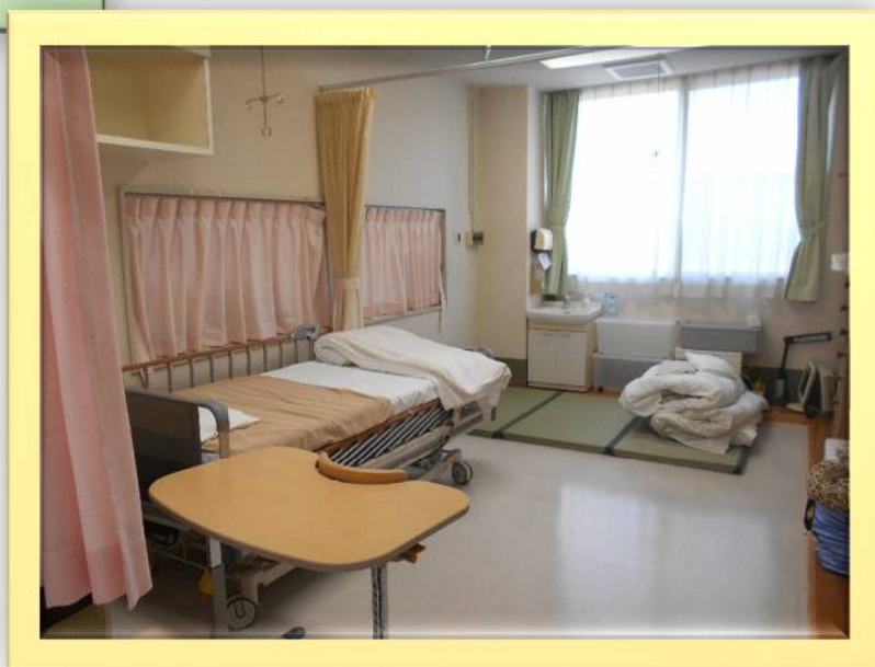
3 病棟短期入所の居室