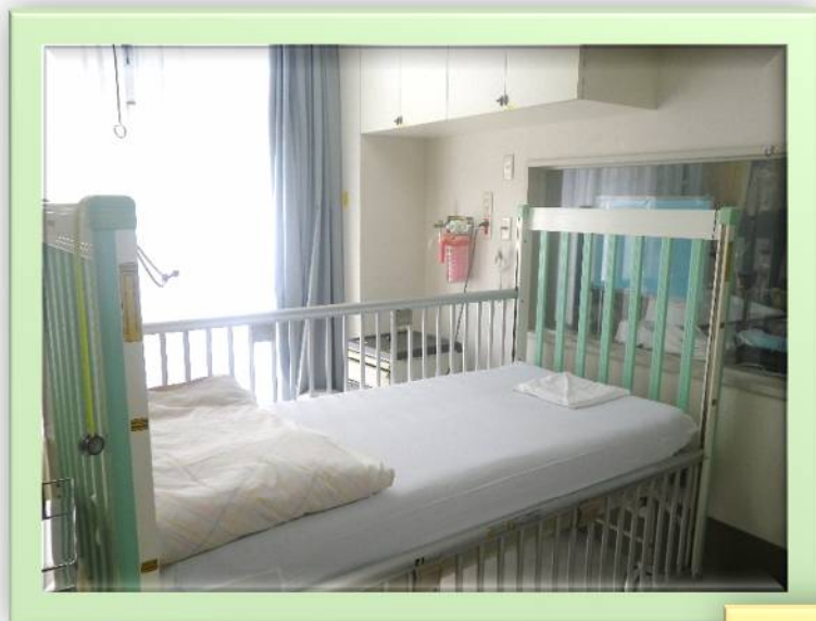
2 病棟短期入所の居室